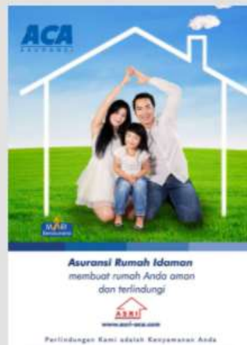
ASURANSI RUMAH IDAMAN (ASRI)